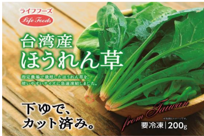
①ほうれん草 200g 台湾