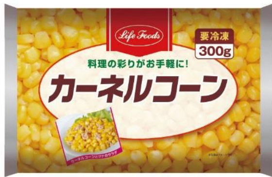
⑥カーネルコーン 300g アメリカ