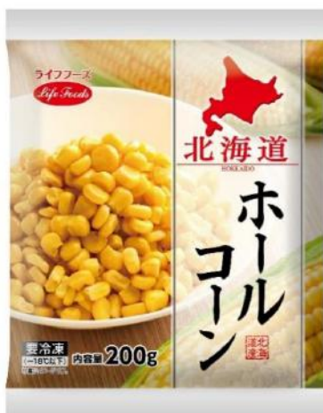
⑩ホールコーン 200g 北海道