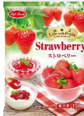
⑤ストロベリー 150g モロッコ