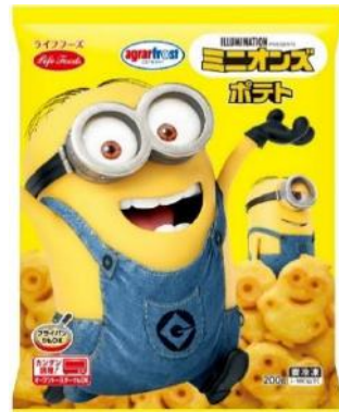
⑧ミニオンズポテト 200g ドイツ