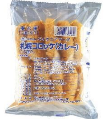
①～④札幌コロッケ (牛肉・野菜・コーン・カレー) 600g(60g×10個) 国産