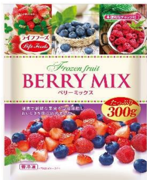
③ベリーミックス 300g モロッコ・カナダ