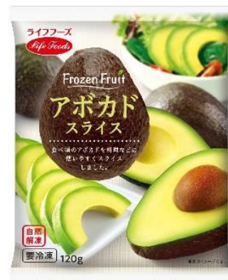
⑥アボカドスライス 120g ペルー