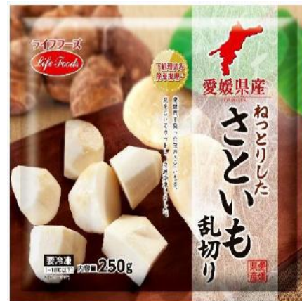
⑪さといも乱切り 250g 愛媛県