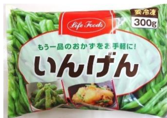
⑤いんげん 300g タイ