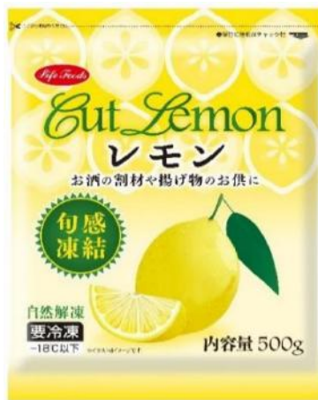
④カットレモン 500g モロッコ