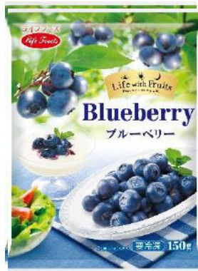
①ブルーベリー 150g カナダ