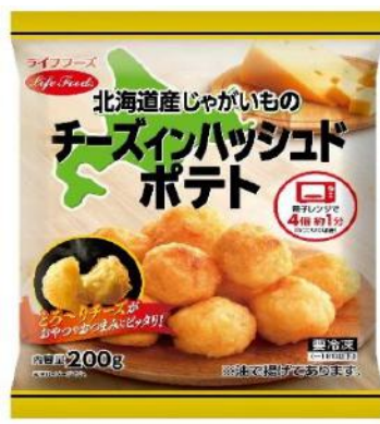
⑥チーズインハッシュドポテト 200g 北海道