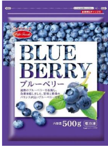
①ブルーベリー 500g カナダ