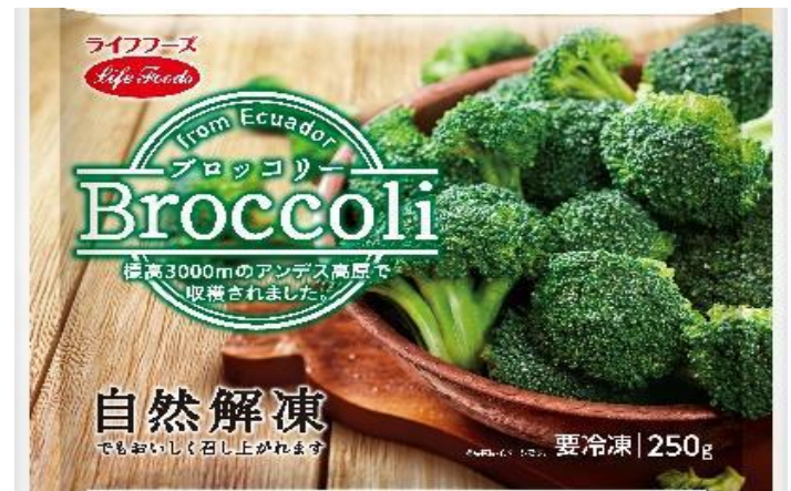
③ブロッコリー 250g エクアドル