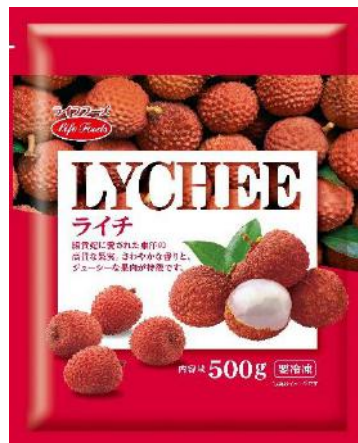
⑦⑧ライチ 500g 中国・ベトナム