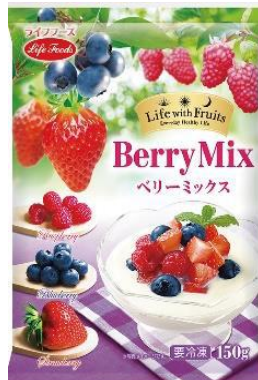
②ベリーミックス 150g モロッコ・カナダ