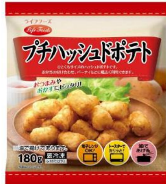
⑨プチハッシュドポテト 180g アメリカ