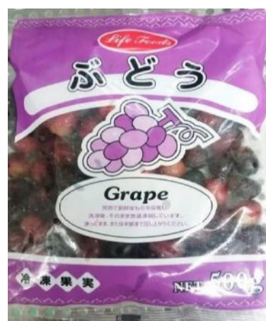
⑤ぶどう 500g チリ