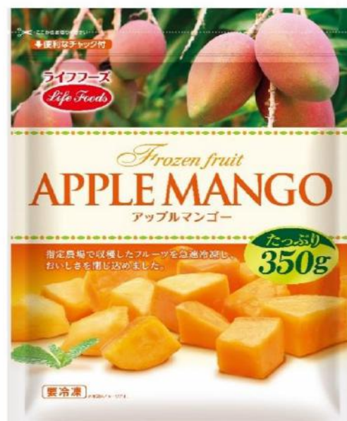
②アップルマンゴー 350g ペルー