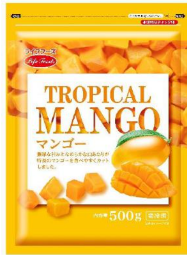
②マンゴー 500g ベトナム