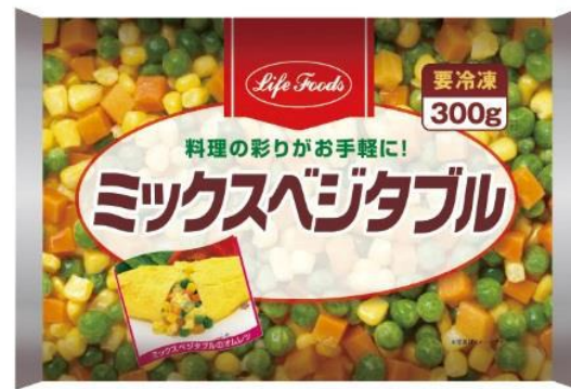
⑦ミックスベジタブル 300g アメリカ