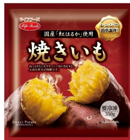
⑨焼きいも 350g 国産