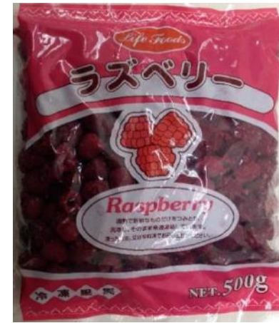
⑥ラズベリー 500g ハンガリー