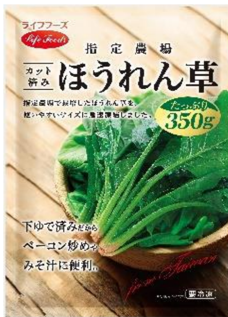
②ほうれん草 350g 台湾