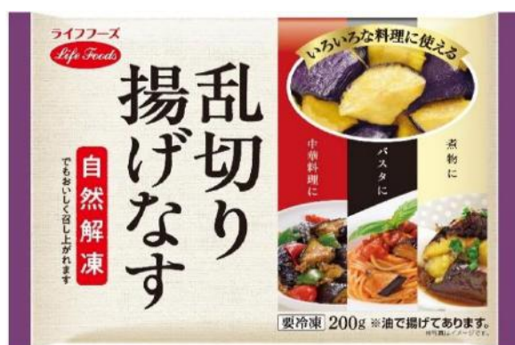
④乱切り揚げなす 200g ベトナム