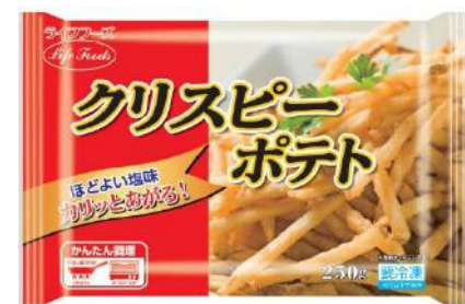
⑩クリスピーポテト 250g アメリカ