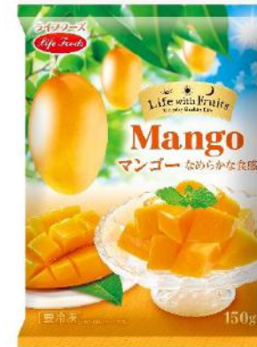
⑦マンゴー 150g ベトナム