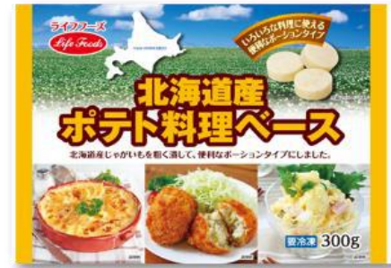
⑦北海道産ポテト料理ベース 300g 北海道