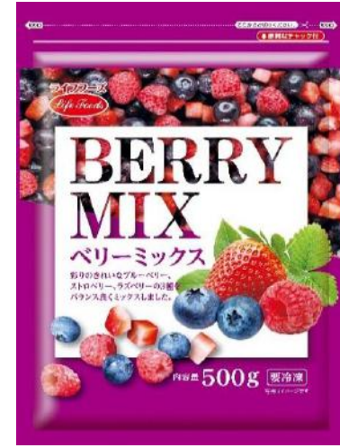
③ベリーミックス 500g モロッコ・カナダ