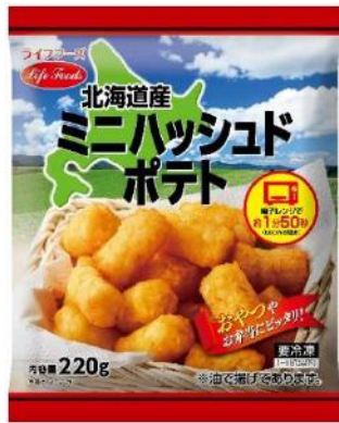
⑤ミニハッシュドポテト 220g 北海道