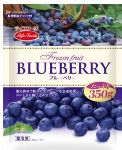
①ブルーベリー 350g カナダ