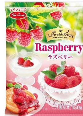
③ラズベリー 150g ハンガリー