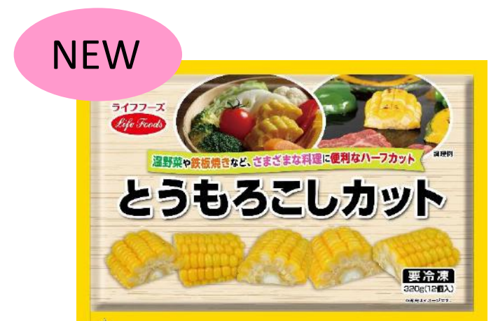
⑥とうもろこしカット 320g (12個入り) ベトナム