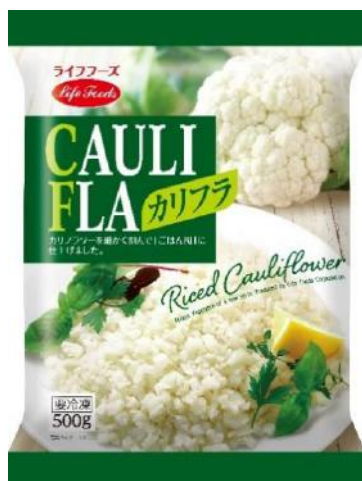
⑧カリフラ 500g メキシコ