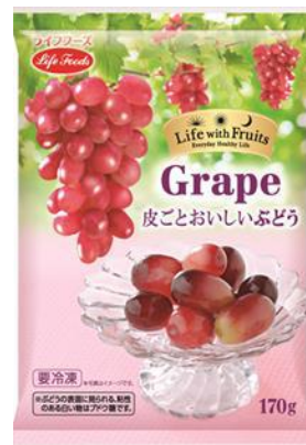
④ぶどう 170g チリ